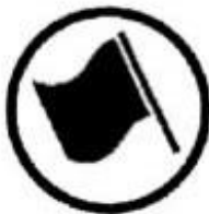
Regularity test start