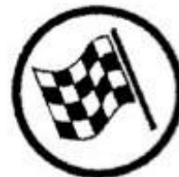
End of regularity test